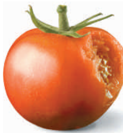
«Che fare quando sanguinano le gengive?» Questa domanda, accompagnata dalla foto di un pomodoro, è stata affrontata nella campagna SSO del 2007.

La gengiva si infiamma quando i batteri della placca, moltiplicandosi producono acidi e in parte morendo, liberano tossine che penetrano nell'epitelio del solco gengivale (formato dalle cellule epiteliali che aderiscono al colletto del dente) e ne diminuiscono la coesione. Anche un sanguinamento durante la pulizia dei denti sta a indicare la presenza di un'infezione. Solo di rado la gengivite provoca dolori. Se la placca viene eliminata accuratamente una volta al giorno, l'infezione e il sanguinamento spariscono nello spazio di pochi giorni. In caso di cattiva igiene orale, se per anni grandi quantità di placca sono costantemente a contatto con le cellule epiteliali, l'infezione si estende fino all'osso e alla membrana parodontale e la gengivite si trasforma in parodontite.