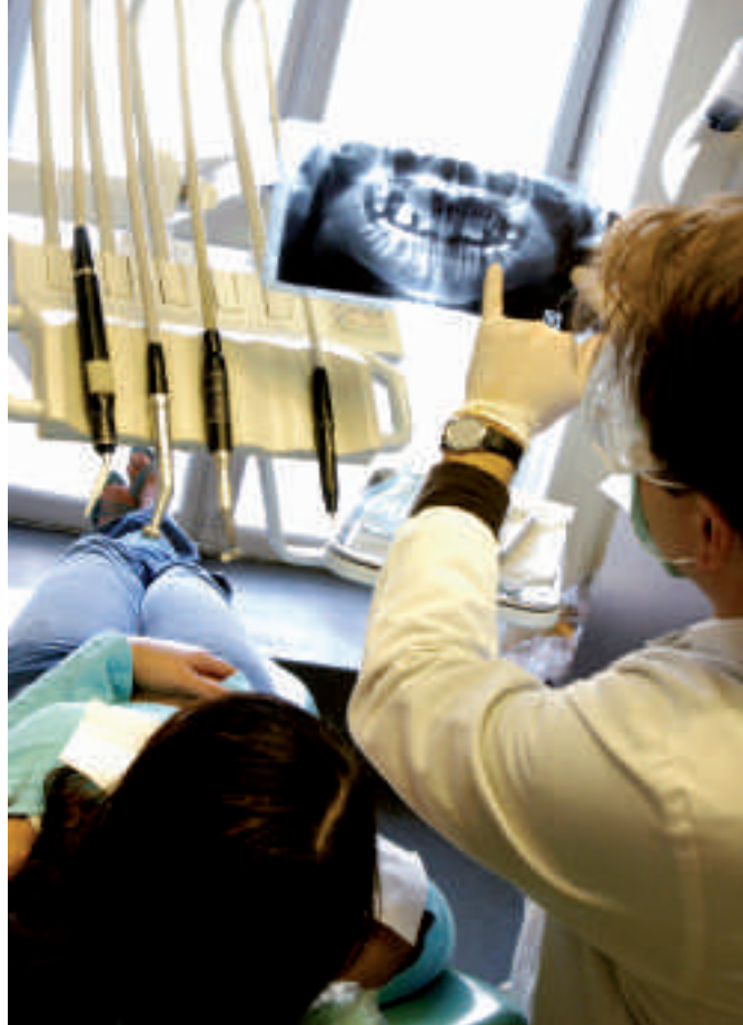
Una spiegazione chiara delle varie fasi del trattamento assicura trasparenza e fiducia.

Se, dopo un trattamento delicato eseguito di venerdì, il dentista dà al paziente il suo numero di telefono, dove il paziente lo può raggiungere in caso di bisogno durante il fine settimana, quest'ultimo si sente più sicuro e certamente non abuserà di questa possibilità. È questo il tipo di wellness che, come pazienti, vi potete aspettare in uno studio dentistico SSO: trattamenti odontoiatrici d'avanguardia e la sensazione di essere quasi a casa.